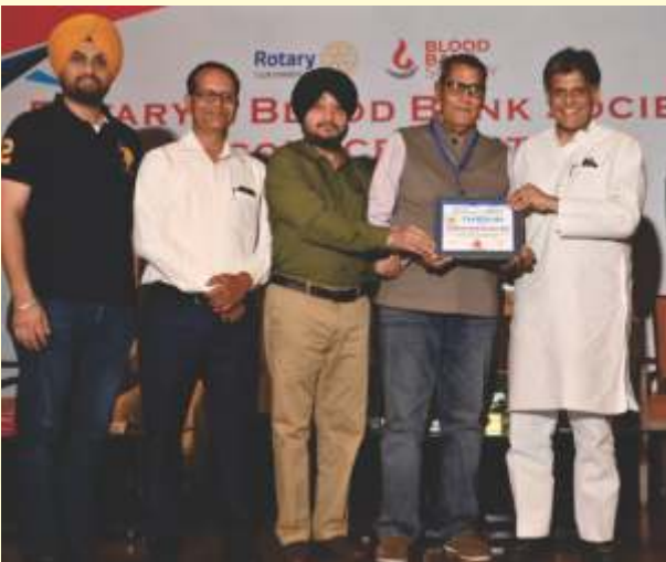
ਬਲੱਡ ਬੈਂਕ ਰਿਸੋਰਸ ਸੈਂਟਰ ਚੰਡੀਗੜ੍ਹ ਵੱਲੋਂ ਸੈਣੀ ਭਵਨ ਦੇ ਪ੍ਰਬੰਧਕਾਂ ਨੂੰ ਸਟਾਰ ਬਲੱਡ ਡੋਨਰ ਵਜੋਂ ਸਨਮਾਨਿਤ ਕਰਦੇ ਹੋਏ ਸ਼੍ਰੀ ਮਨੀਸ਼ ਤਿਵਾੜੀ, ਐਮ.ਪੀ.