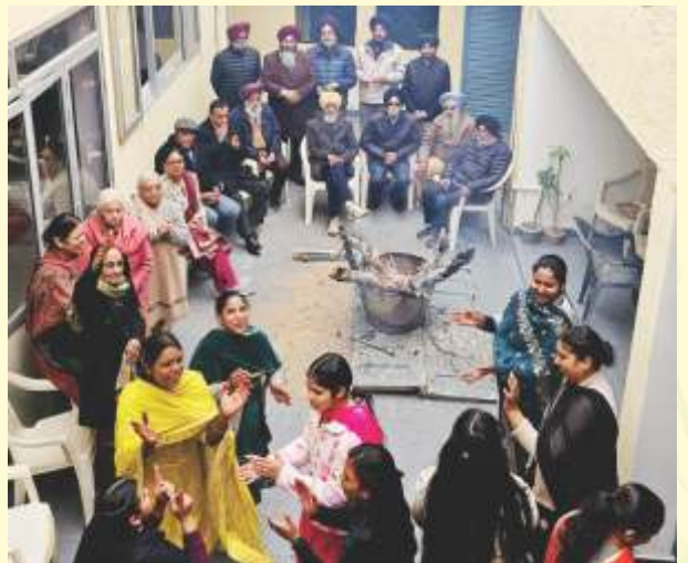
ਸੈਣੀ ਭਵਨ ਵਿਖੇ ਲੋਹੜੀ ਦਾ ਤਿਉਹਾਰ ਮਨਾਉਂਦੇ ਹੋਏ ਪ੍ਰਬੰਧਕ ਅਤੇ ਸਿੱਖਿਆਰਥਣਾਂ