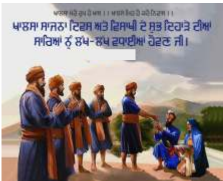
ਵਾਹ ਵਾਹ ਗੋਬਿੰਦ ਸਿੰਘ ਆਪੇ ਗੁਰ ਚੇਲਾ